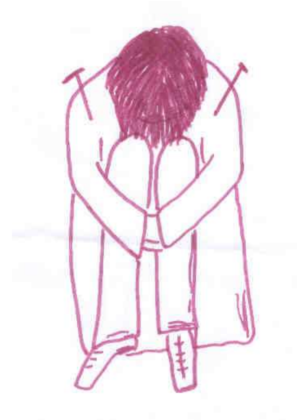
Symptombild einer 58jährigen Schmerzpatientin